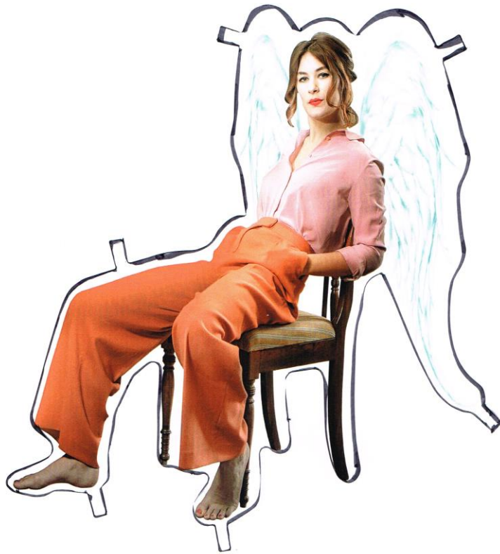
Nora I 1916 som et glansbilde

Nora er en av verdenslitteraturens store kvinneroller og Et dukkehjem er nokså sikkert Ibsens mest kjente og spilte stykke.